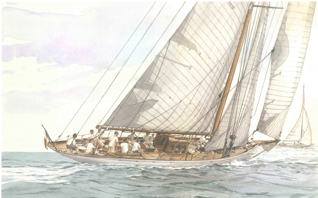
PATIENCE, cutter aurico, progetto di Charles E. Nicholson, varato nel 1934